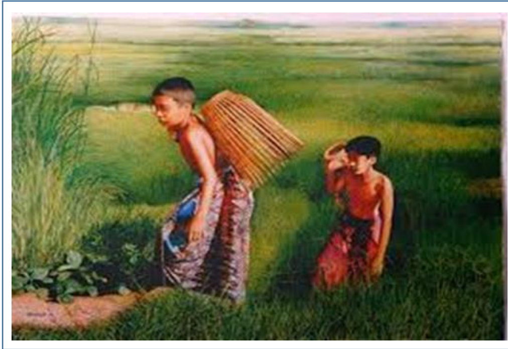
Serkap Ikan (1990 an) Oleh Shafie Hassan

Merujuk Gambar 4 di atas, menunjukkan karya Shafie Hassan yang bertajuk Serkap Ikan (1990 an). Huraikan karya tersebut dari aspek kebudayaan dan persekitaran .