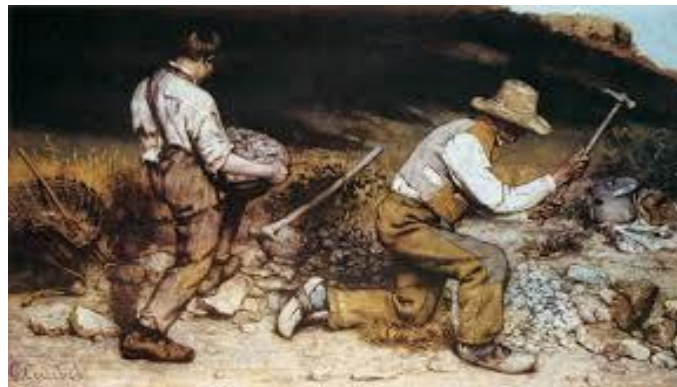
The Stone Breakers (1849) Cat Minyak

(a) Apakah jenis karya pada Gambar 1 dalam seni visual.