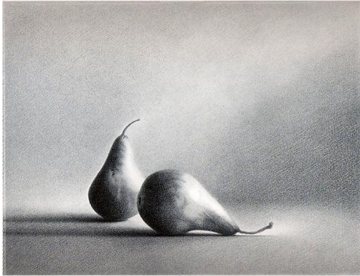
Two Bosque Pears ,(1986) oleh Martha Alf

Berdasarkan Gambar 2 di atas, menunjukkan hasil karya oleh Martha Alf berjudul Two Bosque Pears (1986). Jelaskan kekuatan karya dari aspek yang berikut: